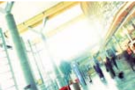
公共場所和商業場所 例如火車站、機場、海軍基地、商店、商場和藥房