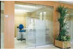
公共場所和服務領域 例如銀行、辦公室、醫院和健身中心