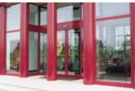
私人空間 例如旅館、餐館、公司和住宅