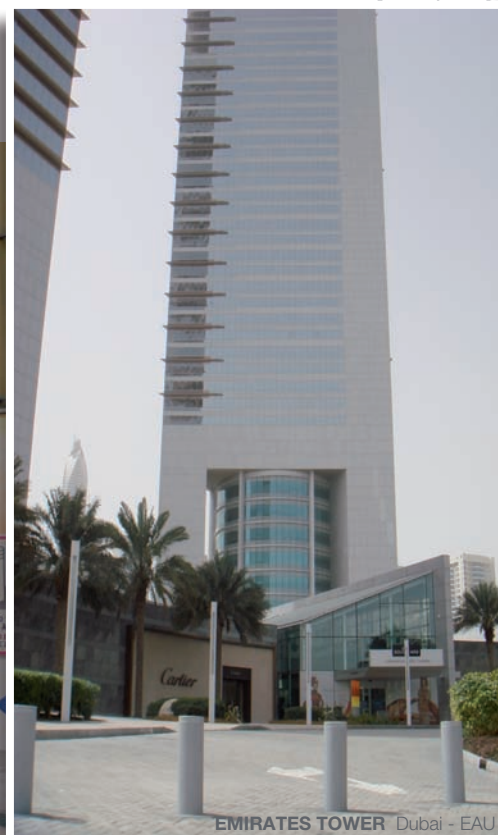
EMIRATES TOWER Dubai - EAU