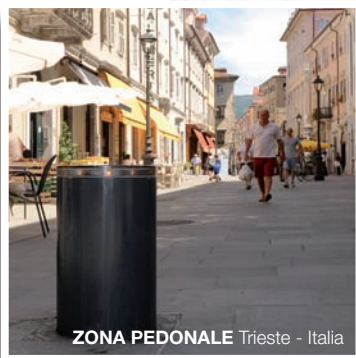
ZONA PEDONALE Trieste - Italia