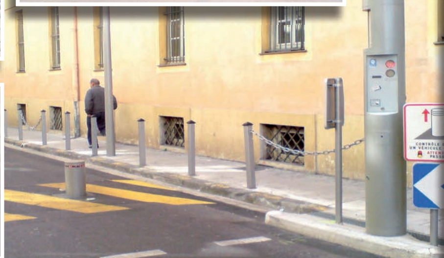
CITTÀ DI NIZZA - Francia