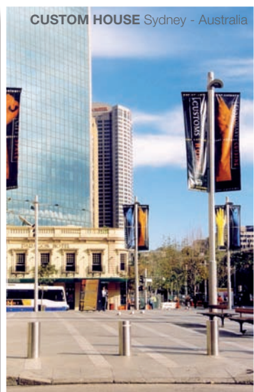
CUSTOM HOUSE Sydney - Australia