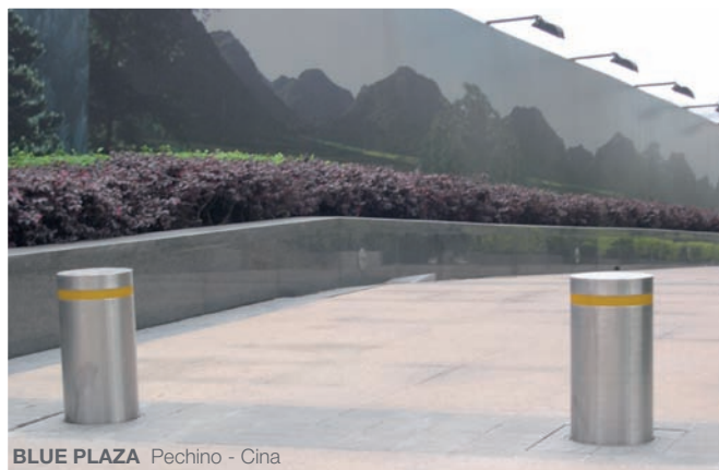
BLUE PLAZA Pechino - Cina